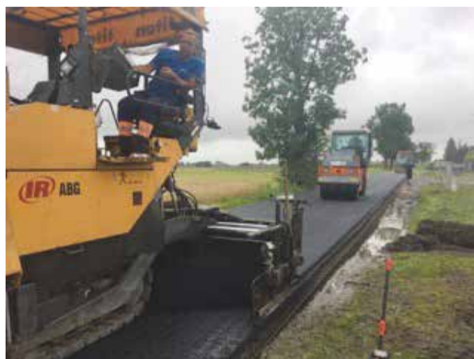
Modernizacja dróg to priorytet dla samorządu.

- Podobną technologią wykonana została droga w Gostkowie – tłumaczy wójt Piotr Kowal. - Inwestycje modernizujące drogi w naszej gminie są priorytetowym zadaniem